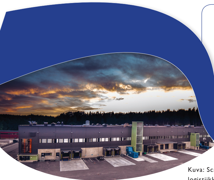
Kuva: Scanoffice Group:n vuonna 2012 valmistuneesta logistiikkakeskuksesta Vantaalla.

GREE Electric Appliances Inc:n maahantuojana Suomessa toimii Scanvarm Oy Ab. Scanvarm Oy Ab kuuluu Scanoffice Groupiin, Pohjoismaiden suurimpaan lämpöpumppujen maahantuonti- ja valmistuttaja yritysyhmään. Suomalainen Scanoffice Group on toiminut vuodesta 1984 ja sen liikevaihto ylittää 30 miljoonaa euroa. Scanoffice Groupiin kuuluvat Suomessa Scanoffice Oy sekä Scanvarm Oy Ab ja Ruotsissa ScanMont AB.